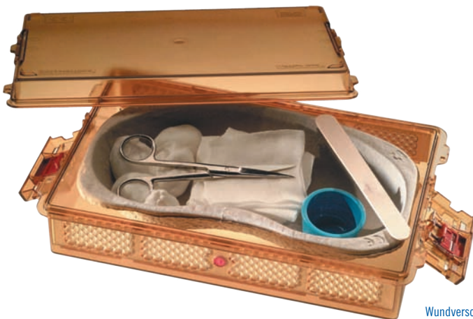
Wundversorgungssets können individuell zusammengestellt werden.

Kurzum: die Ritter polysteribox® ist die Lösung für Fragen der Sterilgutaufbereitung, -lagerung und -logistik in Zeiten stärkerer staatlicher Kontrollen und steigender Anforderungen für validierte Systeme und Abläufe in der Sterilgutversorgung.