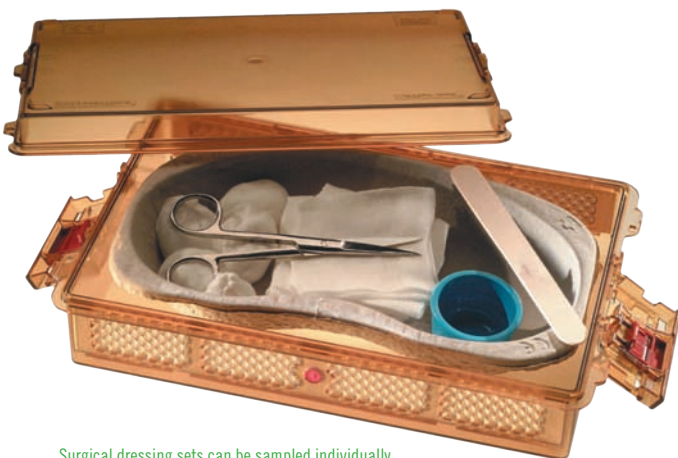
Surgical dressing sets can be sampled individually.